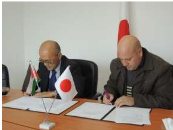
Amb. Matsuura and Anata Head of Local Council signing the grant contracts