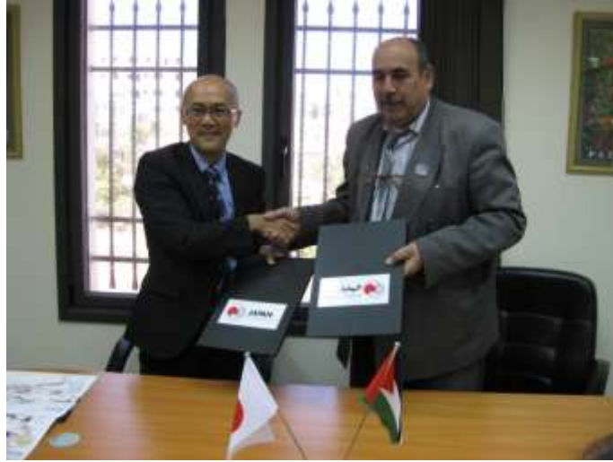
Mr. Matsuura signing the Grant Contracts with Azzoun Mayor

VIP2 Center 3 rd Floor, Yazoor Street, Al-Bireh, Palestine Tel. 02-2413120/1/2 Fax. 02-2413123 repjapan@mofa.go.jp www.ps.emb-japan.go.jp