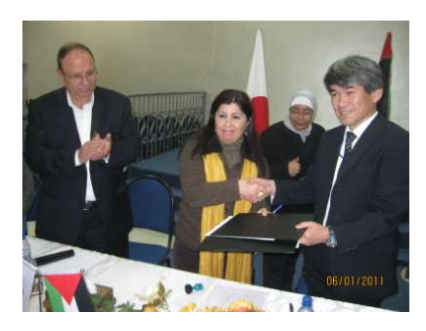
A scene of exchanging the project grant contract

Al-Wataniah Towers 5<sup>th</sup> Fl., Al-Bireh Municipality St., Al-Bireh Tel. 02-2413120/1 Fax. 02-2413123 repjapan@repjapan.ps